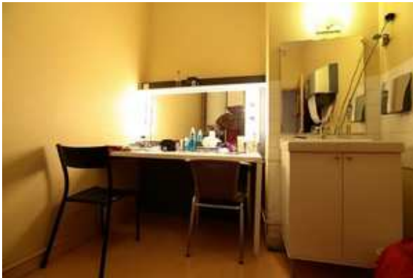
1 loge - capacité 2 Pers.