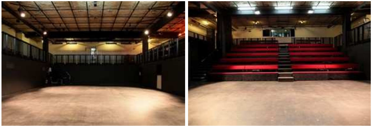
La scène vue du gradin – Le gradin vu de la scène