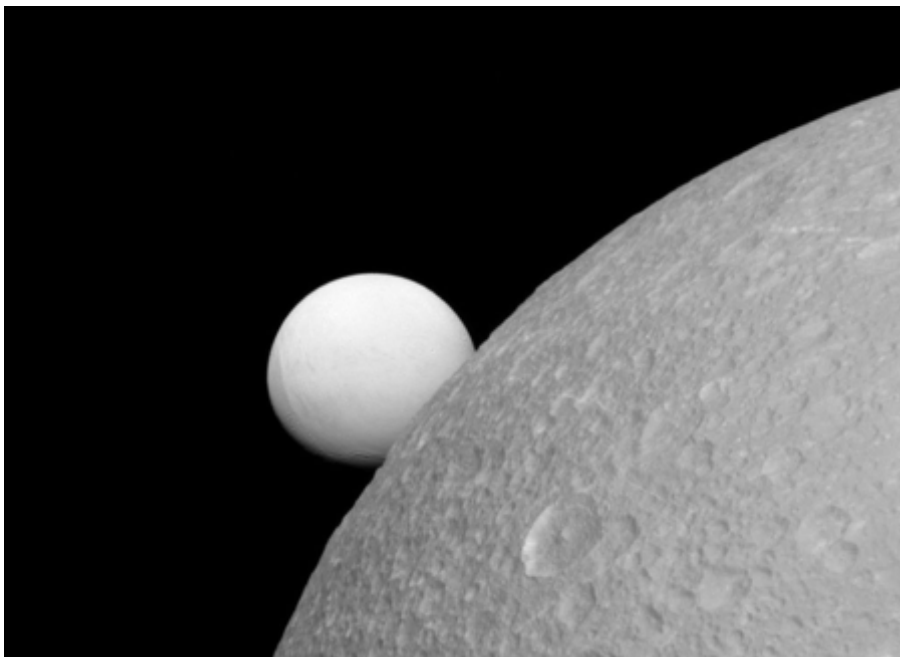
Encelade et Dioné jouent à cache-cache, Nasa

Nous questionnons l'homme dans son rapport au monde symbolique et sensible dans un langage sensoriel proche de celui l'enfance. Guidés par les paroles d'enfants, nous allons à la rencontre de ce qui nous relie au ciel et aux étoiles, du plus petit de nos cellules jusqu'à l'architecture fascinante du cosmos. Sans doute la lune fut la première forme abstraite contemplée par l'humanité. Nous célébrons l'art présent au cœur de la nature par une fable poétique ouvrant les portes de l'imaginaire.