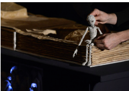
L'enfant au sac - Gilles Aufray

D'une fable poétique à un road movie délirant, ces trois petites formes marionnettiques aux univers singuliers nous questionnent sur la difficulté de grandir et de trouver sa place dans le monde. Elles nous parlent de ce qui fait la vie, avec ses peurs, ses rêves et ses fous rires.