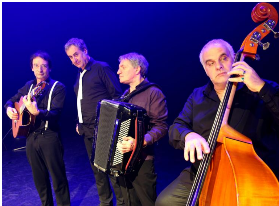
... et les quatre garçons d'Entre 2 caisses sur la scène, pour ce spectacle qui rend hommage aux femmes.